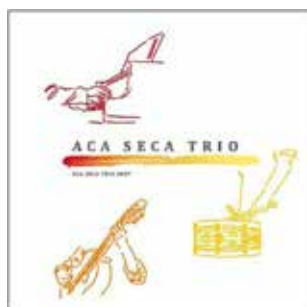
ACA SECA TRIO BEST / JAPAN | 2007