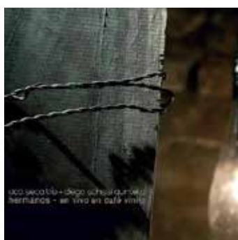
HERMANOS | 2014