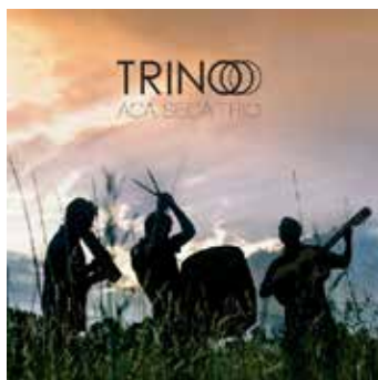
TRINO | 2018