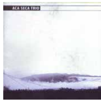
ACA SECA TRIO | 2003