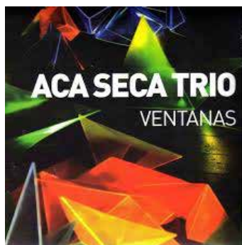
VENTANAS | 2009