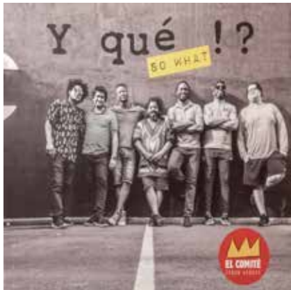
EL COMITÉ [2018]