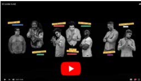
EL COMITÉ | DIRECTO https://youtu.be/151UE9o2Vro