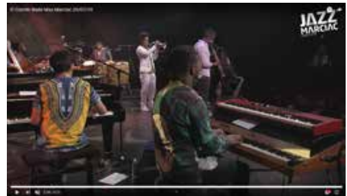
EL COMITÉ | JAZZ IN MARCIAC https://youtu.be/-RWT8dh4tUY