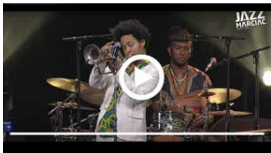
EL COMITÉ | JAZZ IN MARCIAC

En el escenario, El Comité, nos ofrece una buena dosis de intensidad, generosidad y energía desbordante.