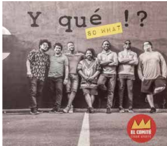
[Y QUÉ?! SO WHAT 2019]