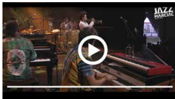
EL COMITÉ | JAZZ IN MARCIAC