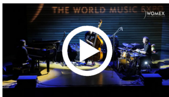
SUMRRÁ AT WOMEX