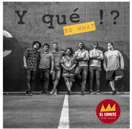
[Y QUÉ?! SO WHAT 2019]

Màxims exponents de la seva generació, aquesta banda de set membres va tenir l'excel·lent idea de trobar-se, a Toulouse, per a un primer concert a l'octubre de 2017. Els set van ser essencials en el procés, impressionants compositors, arranjadors i solistes, van anar trobant el seu lloc per tal d'assolir l'equilibri i la cohesió necessari. Els nou títols que componen "Y qué!?" (So What) "reflecteixen la diversitat d'influències i ritmes d' El Comitè. Afrobeat, funk, latin jazz ... "cubans groove de segle XXI servit de la millor manera.