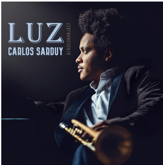
[[LUZ · BALAI O RECORDS 2019]

Un disc vibrant que proposa llibertat i versatilitat musical de manera natural i molt personal.